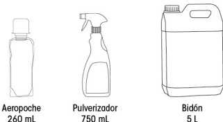
Aeropoche 260 mL