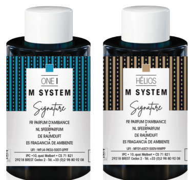
« M » SYSTEM Geurcartridge 100 mL ONE I et Hélios