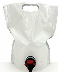
OPLADEN ONE I et Hélios 2,2 L