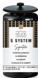
« S » SYSTEM Geurcartridge 25 mL ONE I et Hélios