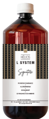
« L » SYSTEM Opladen 1 L* ONE I et Hélios