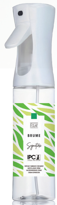
BRUME 270 mL Éclat

Gamme « L » • « M » • « S » SYSTEM Difusor de vapor seco