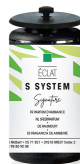
« S » SYSTEM Cartucho 25 mL Éclat