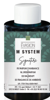
« M » SYSTEM Cartucho 100 mL Évasion