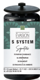
« S » SYSTEM Cartucho 25 mL Évasion