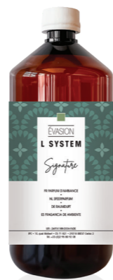
« L » SYSTEM Recarga 1L Évasion