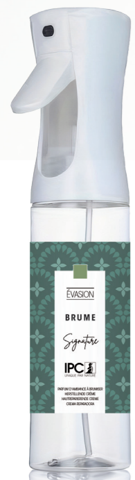
BRUME 270 mL Évasion

Gamme « S » • « M » • « L » SYSTEM Difusor de vapor seco