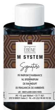
« M » SYSTEM Cartucho 100 mL Ébène