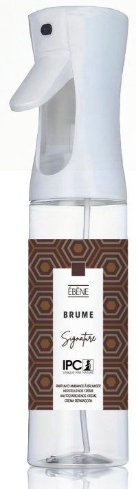
BRUME 270 mL Ébène

Gamme « S » • « M » • « L » SYSTEM Difusor de vapor seco