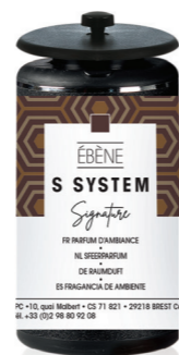
« S » SYSTEM Cartucho 25 mL Ébène