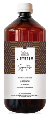
« L » SYSTEM Recarga 1 L Ébène